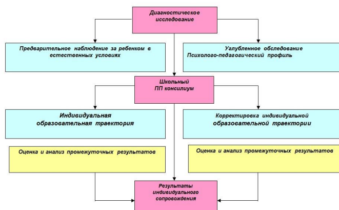
Рисунок 2. Схема взаимодействия педагогов и специалистов

имеющихся проблем, разработки и реализации образовательной траектории, представленной на рисунке 2.